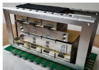
Module en cours d'assemblage